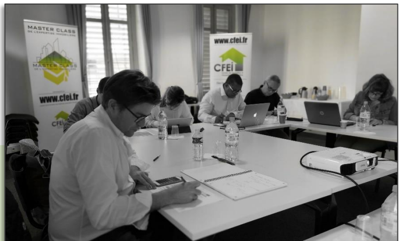
Session de formation du CFEI | Exercices pratiques