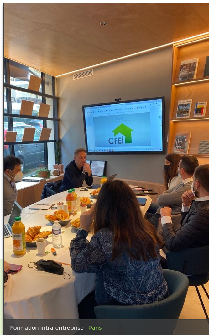
Formation intra-entreprise | Paris